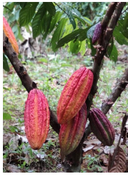
Dos Estaciones: Kakaoprodukte