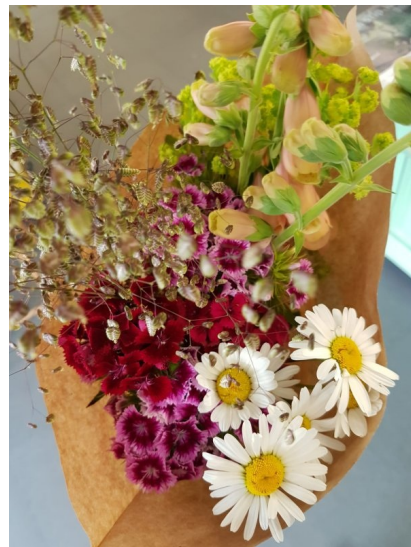
Landstreich – Wilde Blumen aus regionalem Anbau um Regensburg

Auch neben der regionalen grünen Frische haben wir neue Ware im Sortiment: