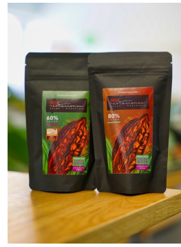
Schokolade und Trinkschokolade