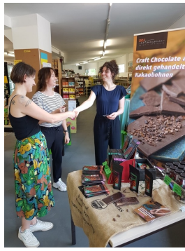
Dos Estaciones - Cacao & Chocolate